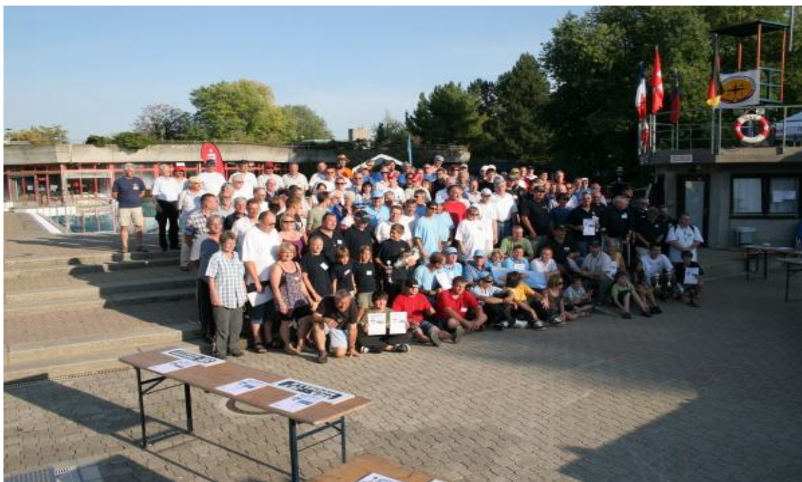
Die Alemannen-Familie